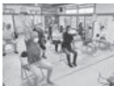
▲いきいきももりん体操