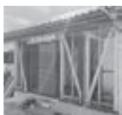
▲住まいの耐震化促進