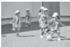
▲特色ある幼児教育・保育