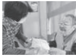
▲歳末助け合い事業への協力(第二方面)