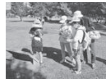
▲縄文ウォークラリーの様子