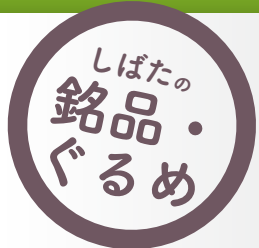
まぼろしの味 ぜいたく味噌

日本国内で自生する最北限の柚子と言われ、果実は皮が厚く香りも良いのが特徴です。愛宕山の中腹にある雨乞地区で4件の農家が生産しています。