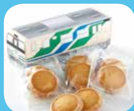
阿武急クッキー 800円(内税)