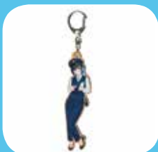
ウッドキーホルダー 【鉄道むすめ】 500円(内税)