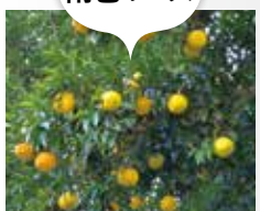
北限のユズ あまご 雨乞のユズ

日本国内で自生する最北限の柚子と言われ、果実は皮が厚く香りも良いのが特徴です。愛宕山の中腹にある雨乞地区で4件の農家が生産しています。