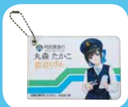
バスキース【鉄道むすめ】 900円(内税)