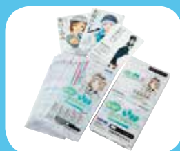
あつめて！全国鉄道むすめ巡り 1,500円(内税)