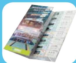
30周年入場券セット 3,360円(内税)