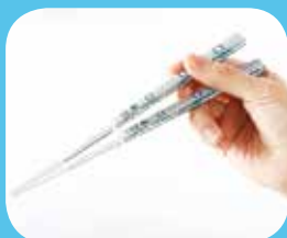
ハシ鉄 阿武急8100系シリーズ 600円(内税)