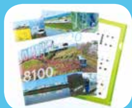
阿武急車両等セットクリアファイル 1,000円(内税)