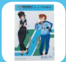
J-TREC コラクリアファイル 300円(内税)