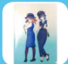
山形鉄道 コラクリアファイル 300円(内税)