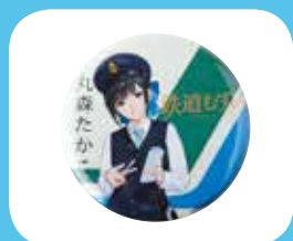
缶パッチ【鉄道むすめ】 300円(内税)