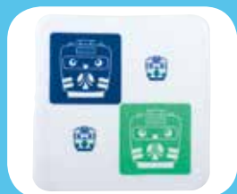
ハンドタオル(公式あぶきゅう ロゴマーク入) 500円(内税)