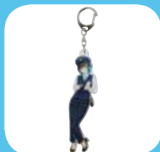
アクリルキーホルダー 【鉄道むすめ】 500円(内税)