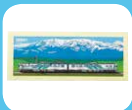
ステッカー【8100系】 400円(内税)