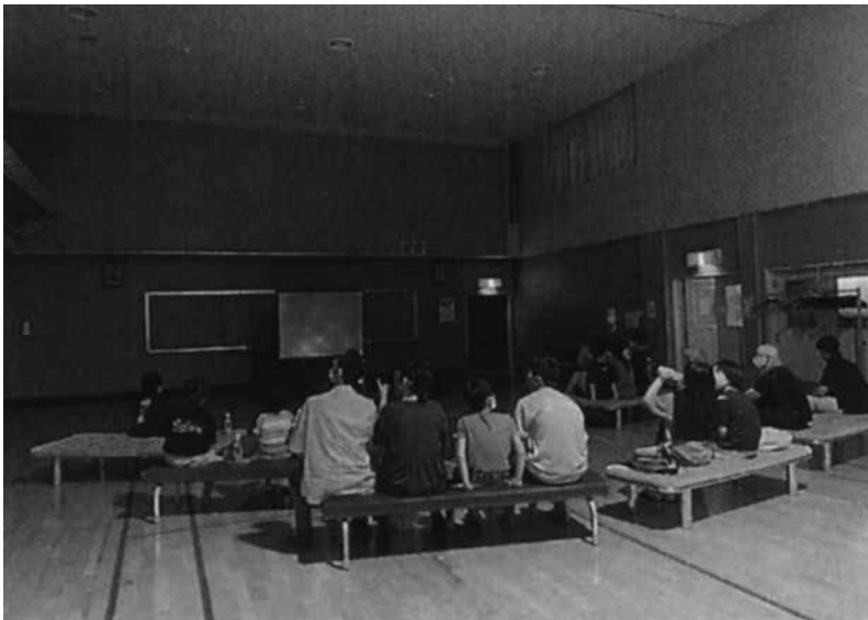
「親と子の映画のつどい」(佐倉地区)