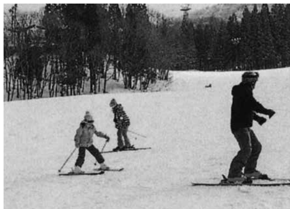
「親子スキー教室」(茂庭地区)