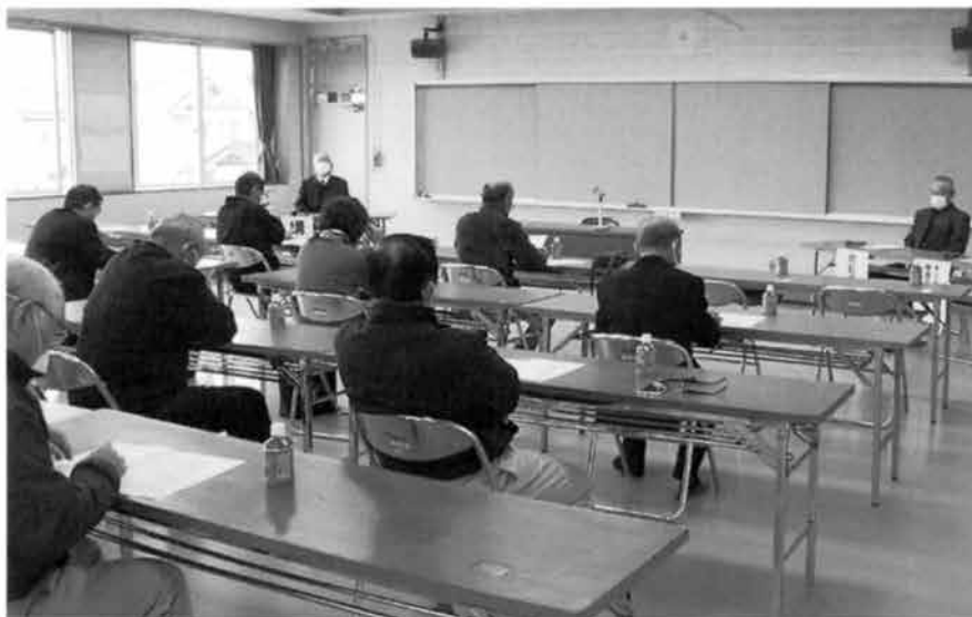
子どもとの関わり方を考える参加者