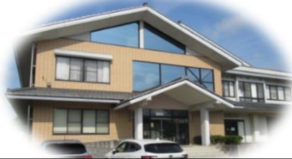
福島市東部学校給食センター