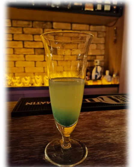
『夜のカフェテラス』の色使いをイメージしたドリンク (Bar Lien)