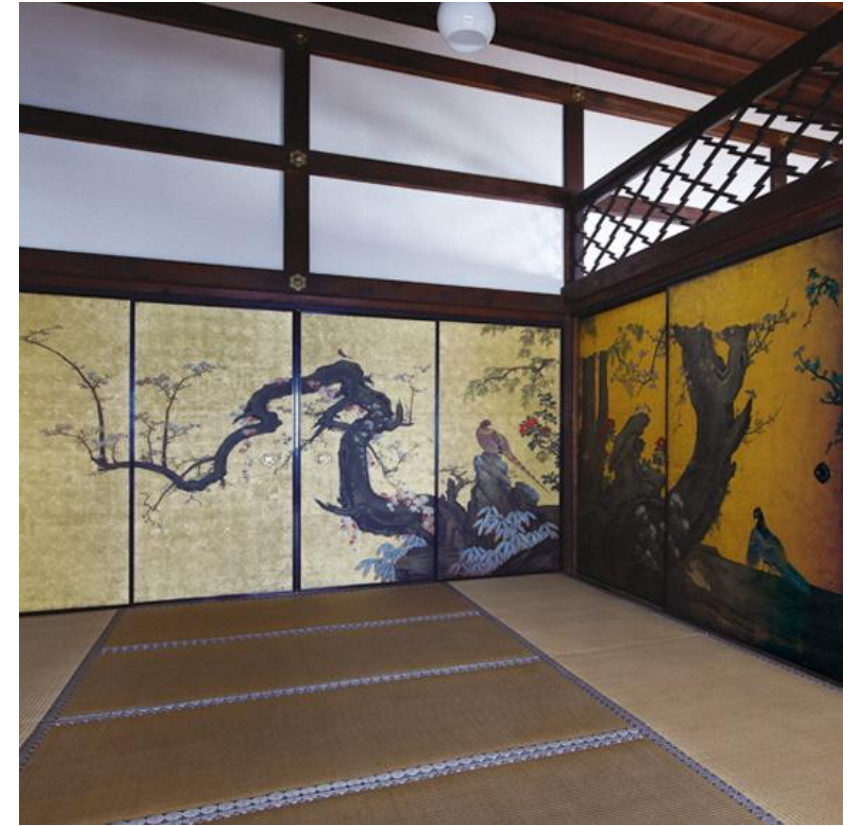
『天球院方丈障壁画』

「十二ヶ月花鳥図」に描かれた世界を音と映像で楽しめるプロジェクションマッピングや、来場者が「見返り美人図」になることができるインタラクティブコンテンツ、京都・天球院の方丈障壁画を再現したイマーシブシアターといった日本美術の魅力を凝縮した映像コンテンツの体験を通して、日本美術をより身近に感じていただけます。