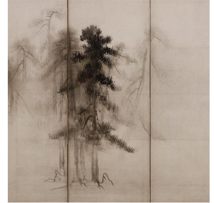
国宝『松林図屏風』 高精細複製品