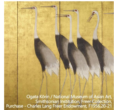
『群鶴図屏風』 高精細複製品

Katsushika Hokusai / National Museum of Asian Art, Smithsonian Institution, Freer Collection, Gift of Charles Lang Freer, F1904.179-180