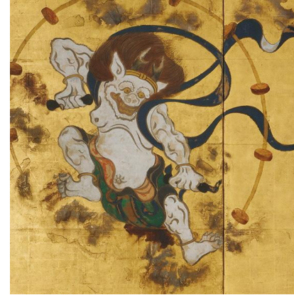
国宝『風神雷神図屏風』 高精細複製品