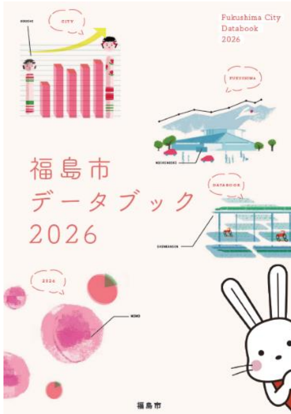
○データブック表紙