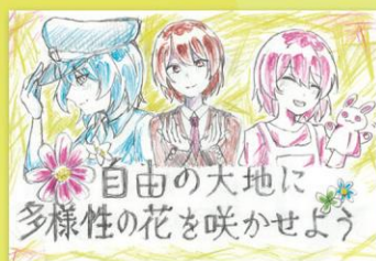
高校生・一般 (イラスト部門)