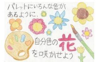
令和7年度小学生の部 最優秀賞作品