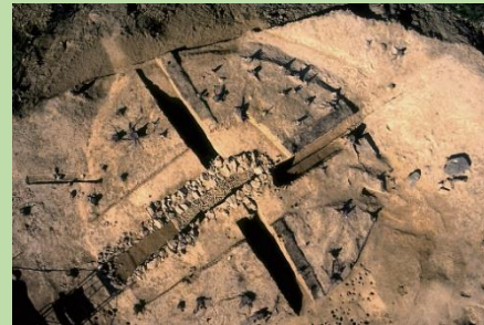
月ノ輪山1号墳全景 (古墳時代)