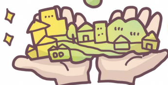
福島市長 馬場雄基