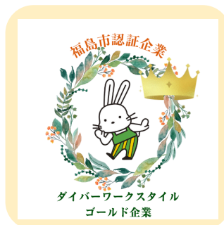
ダイバーワークスタイルゴールド企業認証マーク