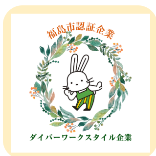
ダイバーワークスタイル企業認証マーク

より良い人材の確保、職場の環境改善、企業のイメージアップのためにも認証を取得しましょう！