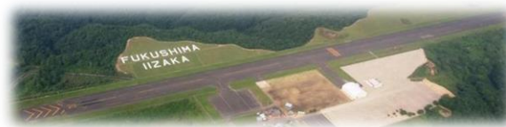
▲ ふくしまスカイパーク