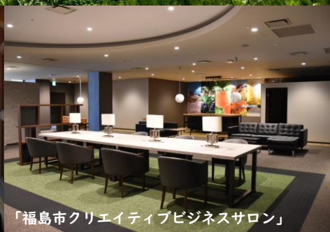
「福島市クリエイティブビジネスサロン」