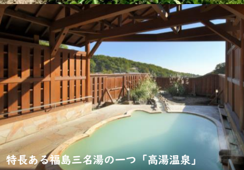
特長ある福島三名湯の一つ「高湯温泉」