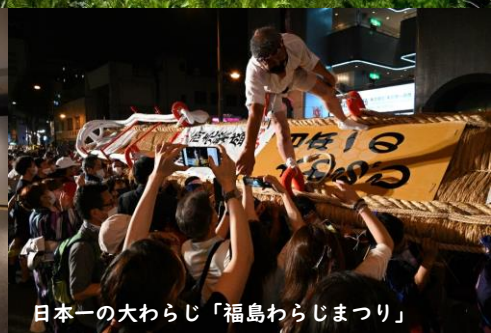
日本一の大わらじ「福島わらじまつり」