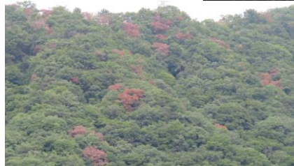
▲ 8月頃、変色したブナ科樹木