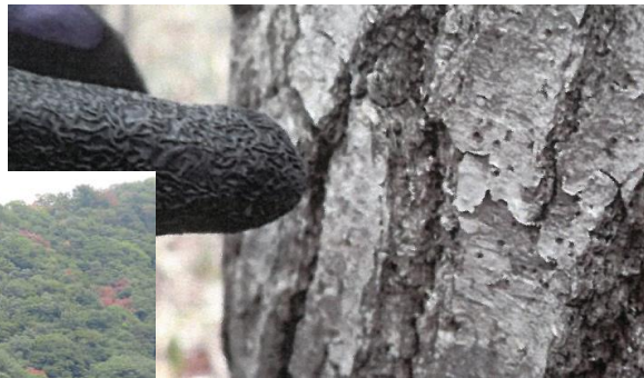
幹にあいた小さな穴 ▲