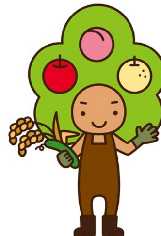
福島市の地域計画促進イメージ キャラクター「人・農地くん」