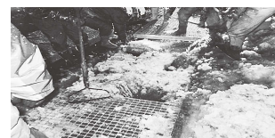
側溝に溜まった雪を排出する様子

宅内や道路などから大量の雪を側溝や用水路に捨てたことで、その場所だけでなく流れた先でも雪が詰まり、水があふれる事象が発生しています。