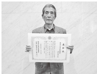
表彰を受けられた降矢支部長