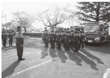
第14分団(笹谷)出発式

「急ぐ日も 足止め火を止め 準備よし」の防火標語により、11月9日(日)から15日(土)の間、令和7年秋季福島市火災予防運動が繰り広げられました。