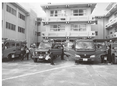
ポンプ車見学の様子

令和7年11月8日(土)、笹谷小学校において「火事からくらしを守る」を学習単元とした社会科出前授業が行われました。当日は、第3学年の児童68名と消防団第14分団笹谷の団員14名、その他関係者が参加し、講話や消防団の活動紹介