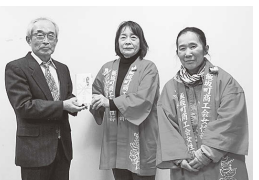
飯坂町商工会女性部