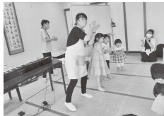
「はじまるよ」の歌でオープニング 毎回たくさんの楽器を使います