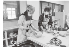
親子で簡単おやつ作り