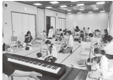
ブームワーカーで絶対音感