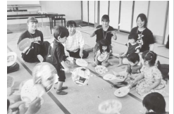
親子で楽しく体を動かして