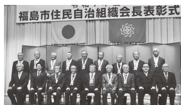
功労表彰を受賞されたみなさん