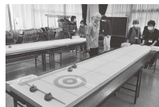
ニュースポーツ体験