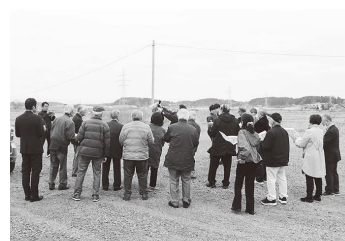
遊水地の現地視察