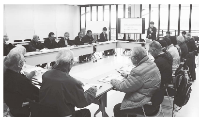
国交省職員より座学による資料説明

鎌田地区自治振興協議会では「内水被害の軽減」を協議テーマに取り組んでいるところではございますが、本研修を通して普段見ることができない現場を見ることができ、地域振興や国・県への要望活動等について理解を深めるきっかけになりました。