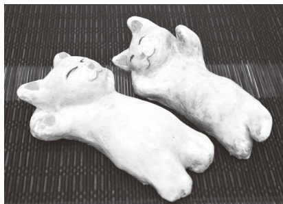
「眠る猫」 熊田 吉弘

今回は動物をモチーフとしたナイフアートを展開し続ける作者の猫の作品。自宅の庭にレイアウトして通行人をなごませていると聞きます。