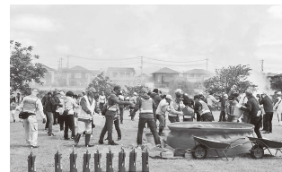
町内会会員による初期消火訓練