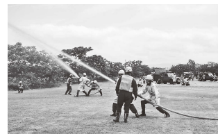
消防団第9分団による中継送水訓練