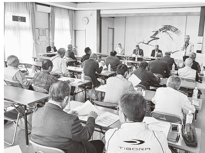
(4月17日 大笹生地区各種団体総会の様子)