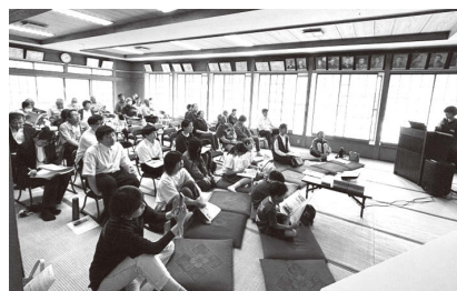
子どもたちの地域振興の想いに熱心に聞き入る地区の皆さん

5月17日(日)に多目的集会所において、第7回「ふくしまジュニアチャレンジ～持続可能な地域へ～」を受賞した児童生徒から、地区の皆さんに対しての受賞報告会が開かれました。