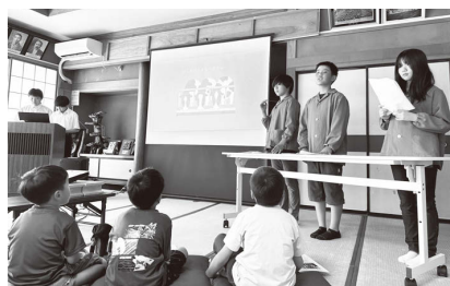
立子山地区の未来を夢いっぱい話してくれた5人の子どもたち