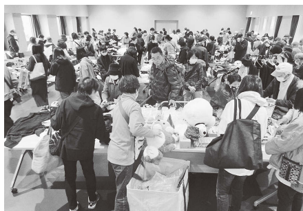
ギフトエコノミー