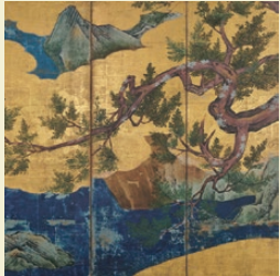
国宝『繪図屏風』高精細複製品* 原本：狩野永徳 筆 | 東京国立博物館所蔵