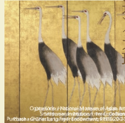
『群鶴図屏風』高精細複製品 原本：尾形光琳 筆 | スミソニアン国立アジア美術館所蔵

国宝・名宝をもとに制作された高精細複製品で、本物さながらの迫力を間近で体験できます。テーマは、「桃山時代の対決」「琳派の巨匠」「江戸時代の浮世絵師」。あわせて、日本美術の魅力を凝縮した映像体験も楽しめます。 時代を超えて実現した、日本美術を代表する絵師たちの競演を、ぜひご覧ください!