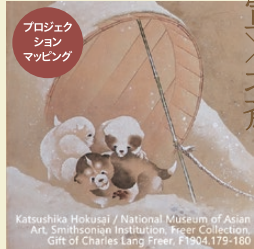
『十二ヶ月花鳥図』高精細複製品 原本：葛飾北斎 筆 | スミソニアン国立アジア美術館所蔵