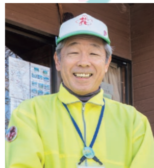
ふくしま花案内人 会長