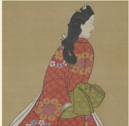
『見返り美人図』高精細複製品* 原本：豊川師宣 筆 | 東京国立博物館所蔵