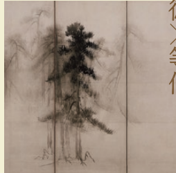
国宝『松林図屏風』高精細複製品 原本：長谷川等伯 筆 | 東京国立博物館所蔵