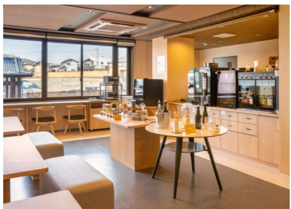
フロント隣の「茶房 matsumomo」。ラボで加工したジュース、県産の日本酒や焼酎、ワインなども含め宿泊料金内で飲み放題

「東日本大震災で避難を余儀なくされ、飯坂温泉に来た皆さんと今もお付き合いがあり、結婚式に呼ばれたり、卒業・入学シーズンにお声掛けいただいたりします。先日、当時は幼稚園児だったお子さんが、「春から専門学校に行くことになりました」とあいさつに来てくれました。きれいごとに聞こえるかもしれませんが、皆さんが『たぐいま』と実家のように思っただけで帰ってこられるところを、そのまま残しておきたいとい