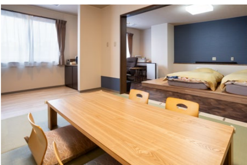
ペット専用フロアにあるペットと泊まれる部屋。食事は朝晩どちらも部屋食。素泊まりプランもある

温泉文化や人情に触れながら働く一方で、自身の感性を温泉街の活性化に寄与する新機軸の若者支援。想像するだけでワクワクしてきますね。次の夢も叶いますように。