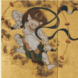
国宝『風神雷神図屏風』高精細複製品 原本：俵屋宗達 筆 | 大本山 建仁寺所蔵