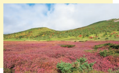
秋は草紅葉の真っ赤なじゅうたんが広がります。