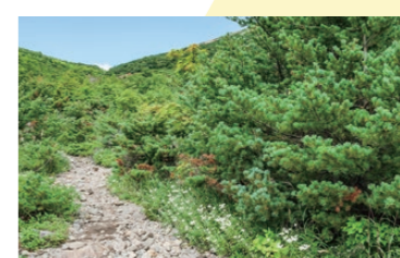
大自然に囲まれた登山道。周辺の植生を守るため、登山道からは外れないよう注意しましょう。