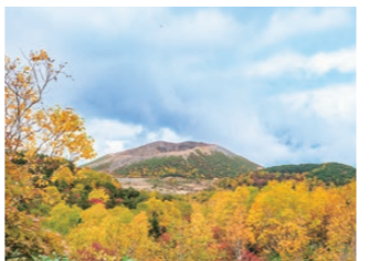
ゴールまであと少し。木々の間から吾妻小富士が見えます。