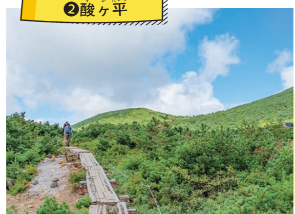
酸ヶ平周辺に出ると、一気に視界が開けます。