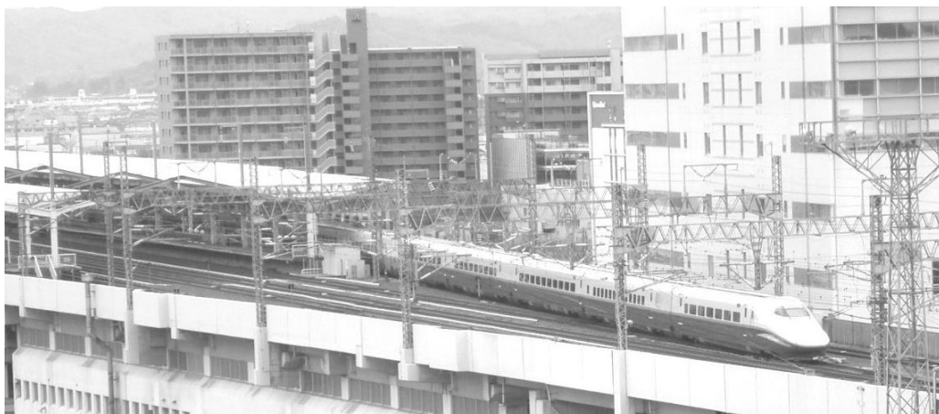
東北新幹線（福島駅）