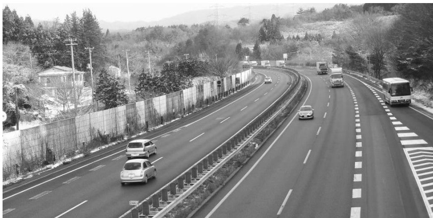
東北自動車道（松川パーキングエリア付近）