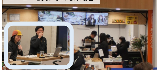
コーヒーを買い求める来場者

当日は会場に隣接した「みんなのカフェあんさんぶる」の当日限定コラボコーヒーを飲みながらのゆったりとした雰囲気の中で開催しました。