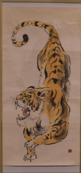
福島市福祉事務所長賞