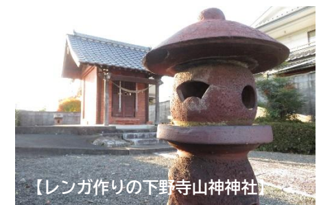
【レンガ作りの下野寺山神社】

(継続)コミュニティ支援事業などを活用して、地区に点在する旧跡を紹介する標柱設置の取り組みを継続します。