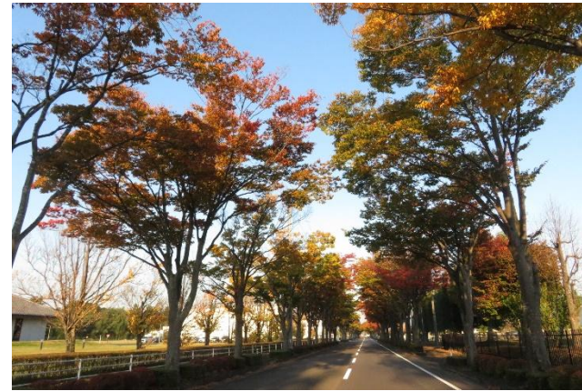
【西工業団地のケヤキ並木】