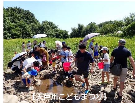
【天戸川子どもまつり】

(継続)吾妻山から流れ出る清流や恵まれた雄大な自然、歴史に育まれた吾妻の里を感じられる「あづまの里ふるさとウオーク」を継続開催します。