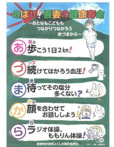
【吾妻地区の健康スローガン】

(新規)社会福祉協議会吾妻協議会、老人クラブ活動、いきいきももりん体操クラブなどを通して、元気に活動できる高齢者を支援します。