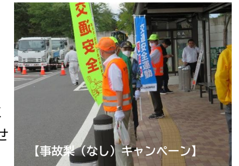
【事故梨(なし)キャンペーン】