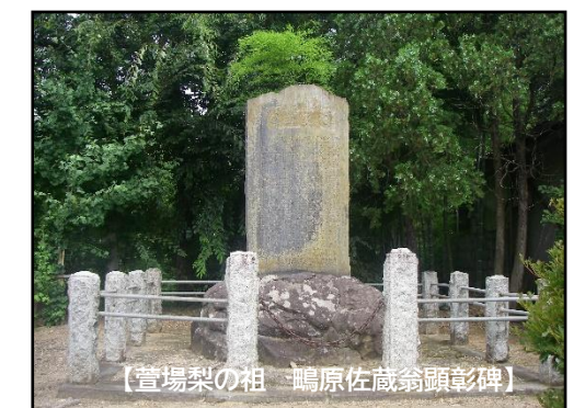
【萱場梨の祖 鶴原佐蔵翁顕彰碑】