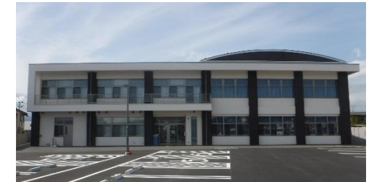
【建て替えされた新三河台学習センター】