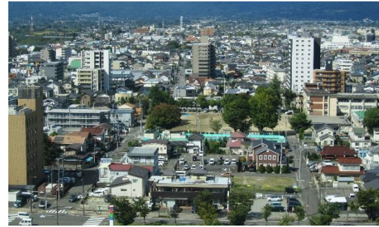
【コラッセふくしまから中央西地区を望む】

「幅広い世代、企業と町内会や地域団体などが 地域で垣根を越えて交流する明るいまち」