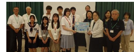
【三河台リーダーズクラブまちづくり提案】