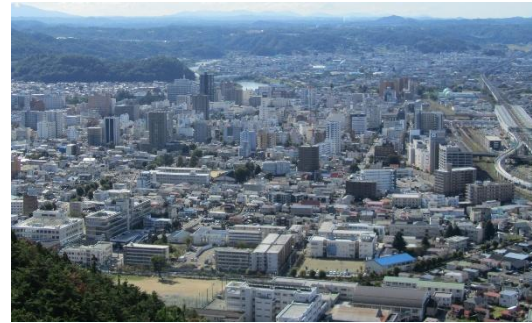
【地区の名所信夫山から地区を望む】

「県都福島市にふさわしい都市機能があり、地域住民が 誇りを持ちながら、ずっと住み続けたいと思えるまち」 「地域住民が互いに協力し、笑顔で子育てができ、安全に 安心して健康に暮らせるまち」 「地域住民と企業、商店街、学生との連携のもと、 市内外から来る多くの人でにぎわうまち」