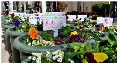
【まちにいろどりを！おもてなし事業】