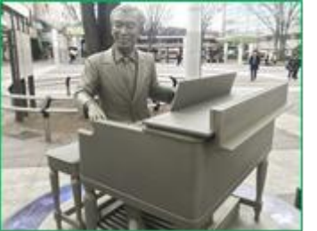
【福島駅東口広場の古関裕而像】