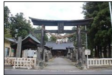
【山王宮日枝神社（余目）】