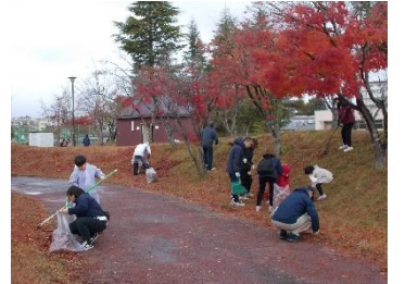
【親子清掃活動の様子】