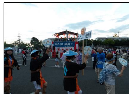
【ほうらい夏まつり（盆踊り）】