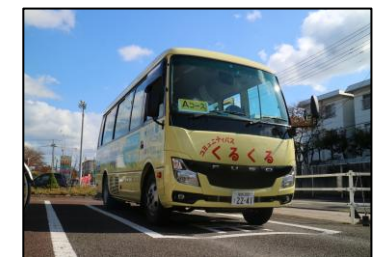
【市内唯一のコミュニティバス「くるくるバス」】