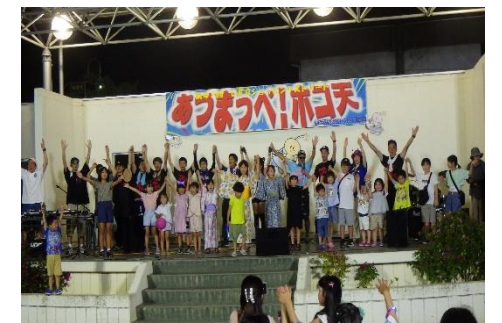
UFOストリート歩行者天国