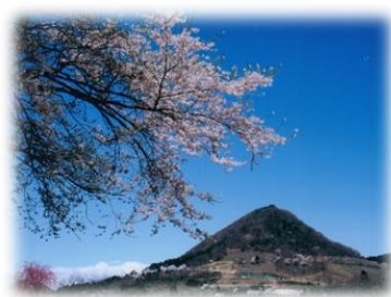
地区のシンボル千貫森