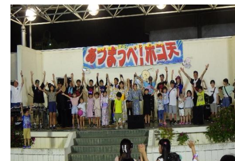
ＵＦＯストリート歩行者天国