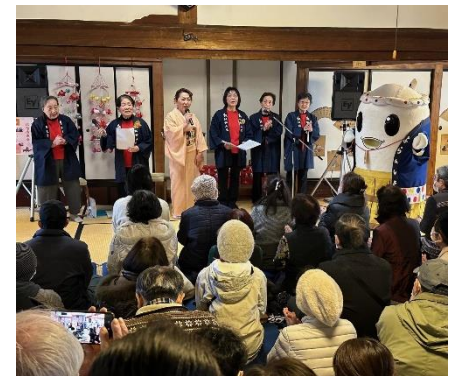
【つるし雛かざり記念演奏会】