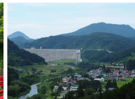
【摺上川ダム周辺地域】