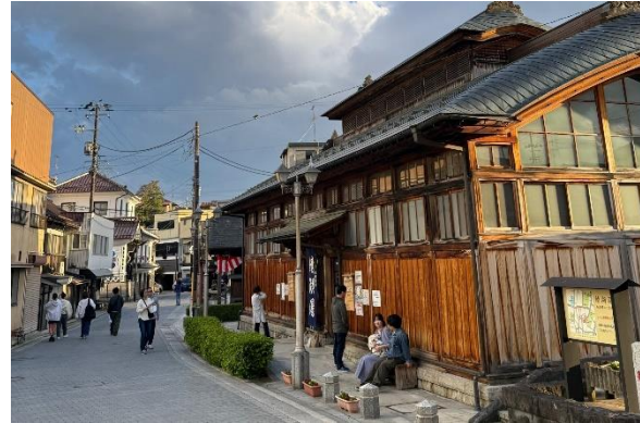
【鯖湖湯と湯沢通り】

「自然、温泉、歴史、特産物等を交流・関係人口の 拡大、さらには定住人口の維持・増加に生かし、 地域全体が活気に溢れ、お互いを尊重し誰もが つまでも住み続けたいまち 美しいざか」