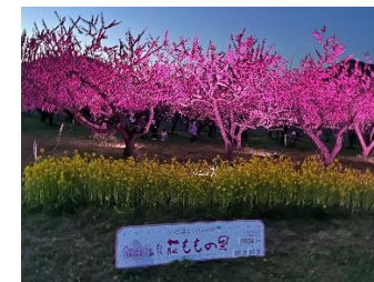
【花ももの里ライトアップ】