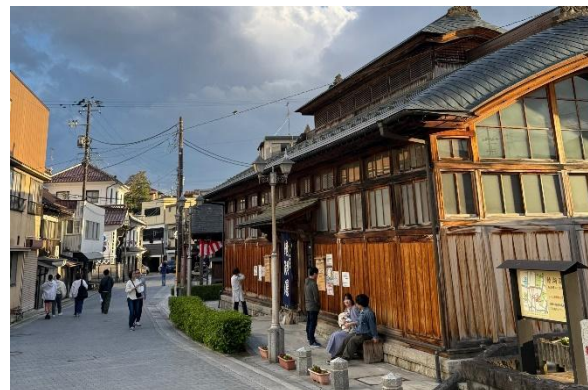
【鯖湖湯と湯沢通り】