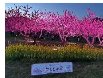
【花ももの里ライトアップ】