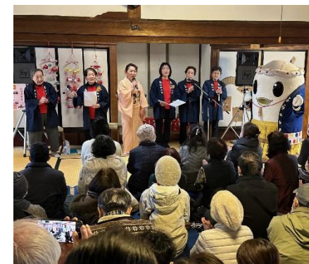
【つるし雛かざり記念演奏会】