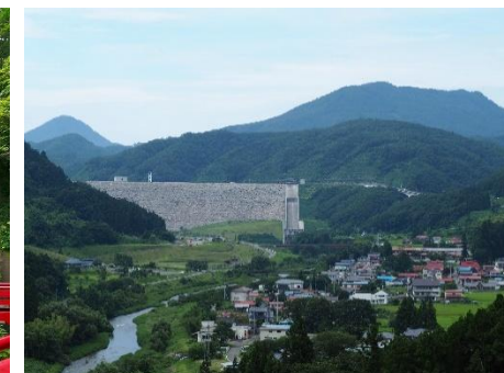
【摺上川ダム周辺地域】