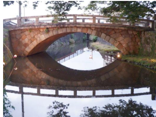
【八丁目宿：めがね橋】