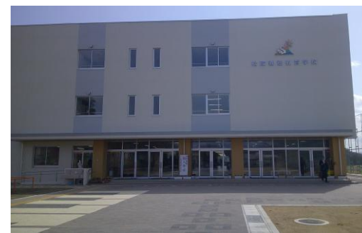
【松陵義務教育学校】