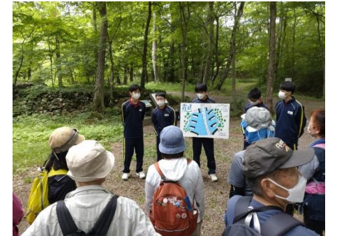
西信中学生による野草、野鳥、堰の案内あらかわふるさとの川ウォーキング大会