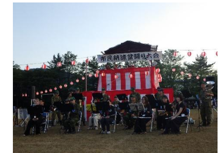
市民納涼盆踊り大会