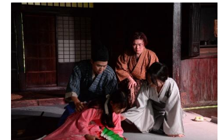
西地区ふるさとの歴史再発見事業