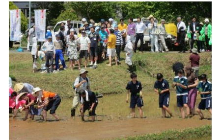
あづまの里「荒井」づくり地域協議会