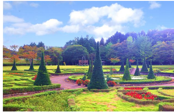
四季折々の景観を楽しめる四季の里