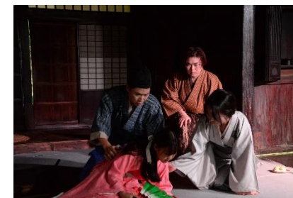
西地区ふるさとの歴史再発見事業