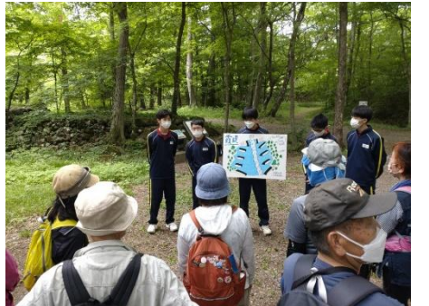
西信中学生による野草、野鳥、堰の案内あらかわふるさとの川ウォーキング大会