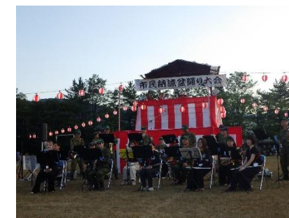
市民納涼盆踊り大会