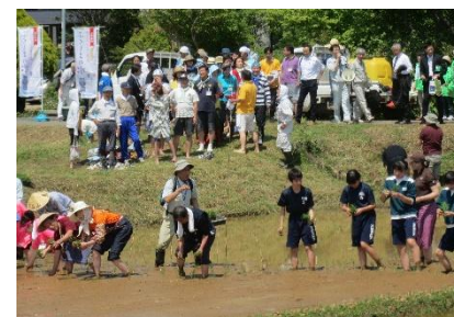
あづまの里「荒井」づくり地域協議会