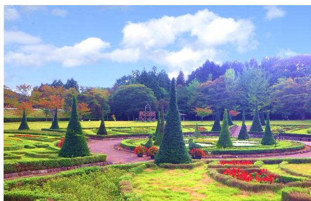
四季折々の景観を楽しめる四季の里