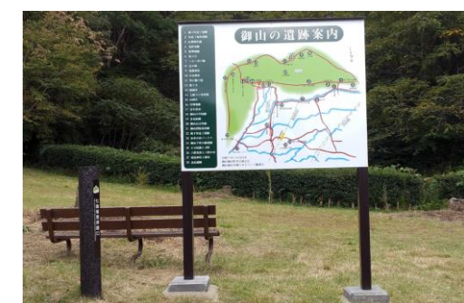
【信夫山の散策案内図】