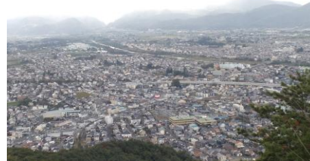
【烏ヶ崎展望デッキから清水地区を望む】