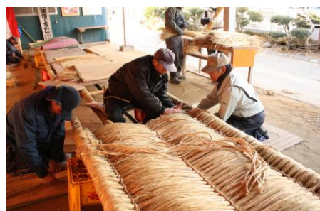
【清水地区の風物詩 大わらじづくり】