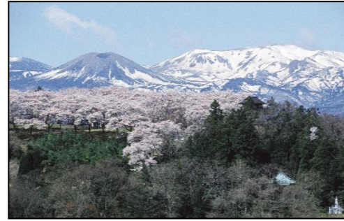
【大森城山と吾妻の雪うさぎ】

「し」しあわせいっぱい、共助の力で 「の」のびのび、生き生き、笑顔で暮らせる 「ぶ」文化と歴史、自然あふれるまちづくり