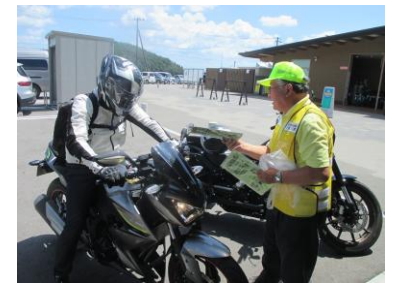
【交通安全啓発活動】