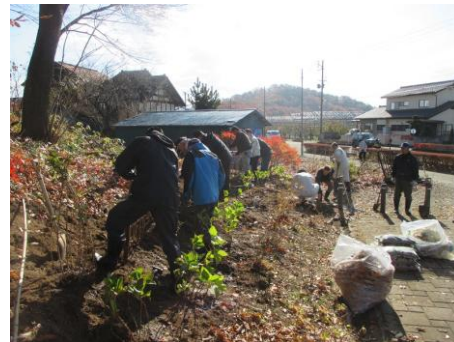
【鬼越山でのアジサイ苗木植栽】