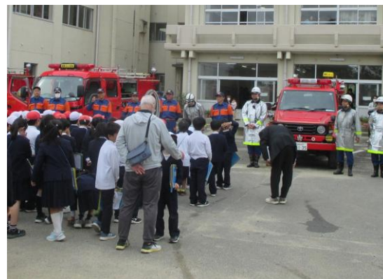
【小学校での消防団出前授業】