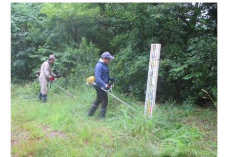
【不法投棄防止看板周辺刈払い】